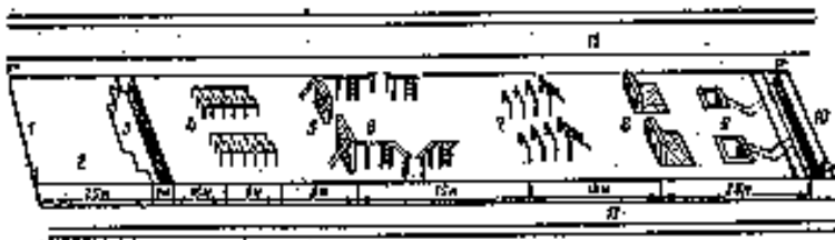
Єдина смуга перешкод